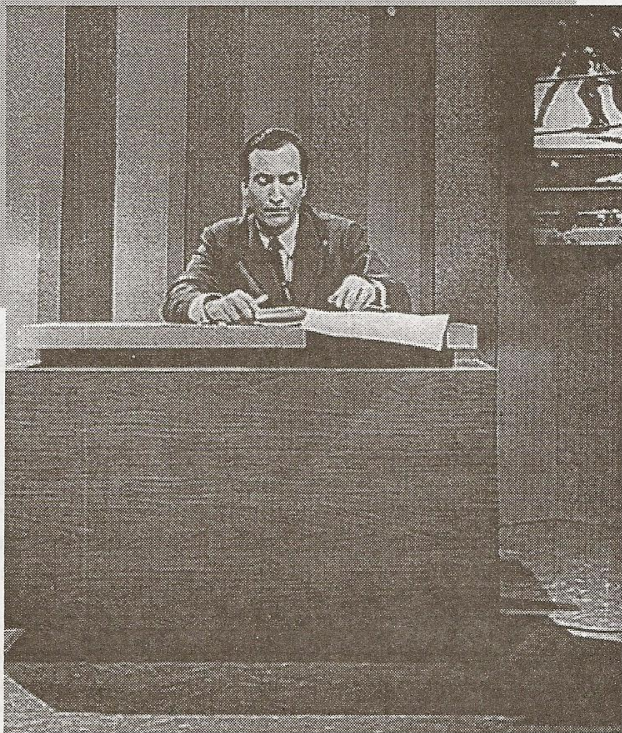
El libro de oro de nuestra televisi3n. ATA.