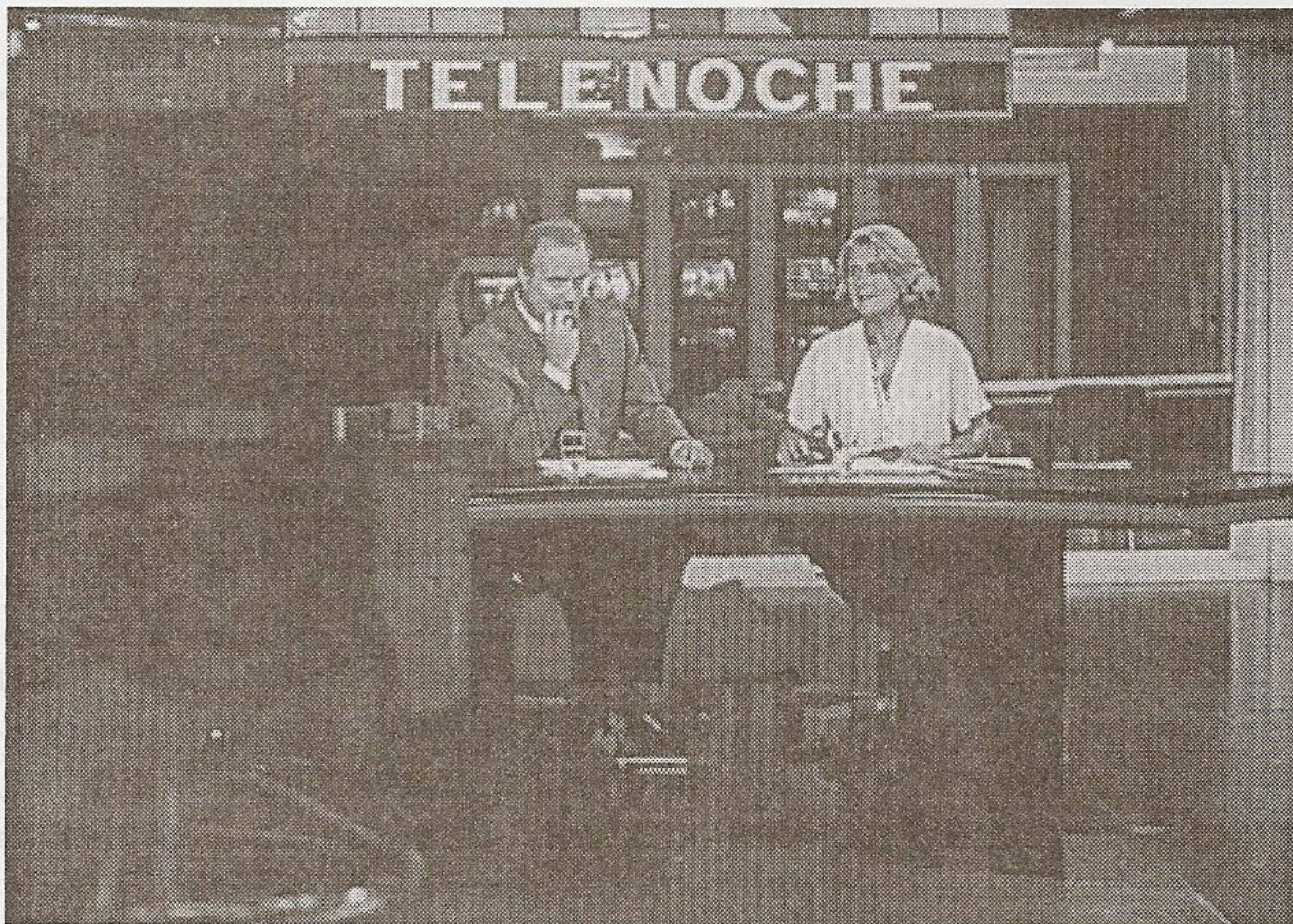
El libro de oro de nuestra televisión. ATA.